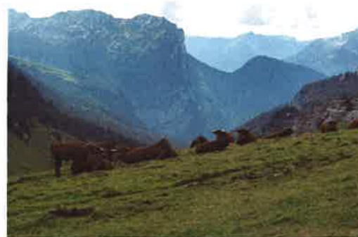
Plan de gestion ecopastoral d'alpages du PNR de Chartreuse

Il ne s'agit pas de proposer des changements de pratiques qui déstabilisent les exploitations en place mais bien d'évaluer les marges de manœuvre des systèmes pour les actionner en faveur de l'environnement tout en répondant aux objectifs économiques des agriculteurs. Cette approche est aussi développée dans les projets de reconquête agricole de milieux en déprise.