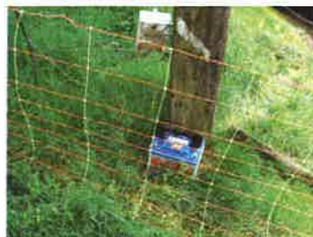
Vulnérabilité d'une exploitation vis-à-vis du risque loup

Terraterre fait le lien entre les agriculteurs et les gestionnaires des sites pour une compréhension mutuelle et un engagement collectif en faveur du projet.