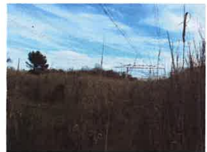
Etude de faisabilité d'entretien de lignes très Haute tension par le pâturage