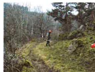
Assistance à maîtrise d'ouvrage pour les chantiers d'ouverture des sites Natura 2000 du Haut Allier Mise en œuvre de travaux d'éclaircie/élagage