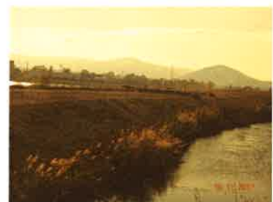
Etude de faisabilité de l'entretien des berges du Rhône par le pâturage