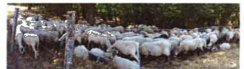
Plan de gestion des landes du Haut Beaujolais Préconisations de valorisation des milieux pastoraux