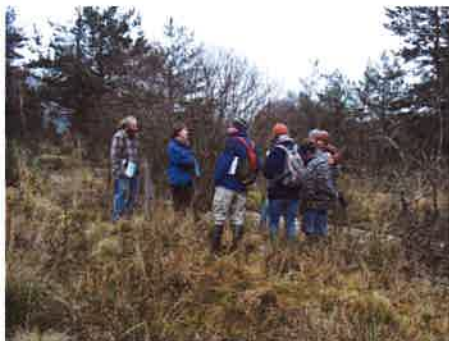
Plan de gestion de la zone humide de la Tuilière Visite de terrain en concertation avec les agriculteurs