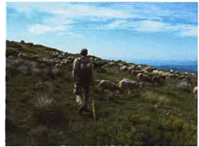
Suivi pastoral du massif du tanargue