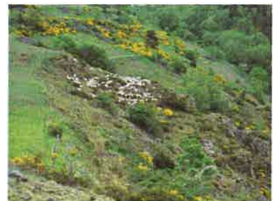
Suivi pastoral des sites Natura 2000 du haut Allier