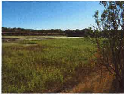
Etude d'impact sur l'activité agricole d'une extension de carrière

Une approche totalement indépendante de ces sujets permet aux maîtres d'ouvrage de disposer d'une étude fiable et de mettre en oeuvre des mesures adaptées au contexte et aux enjeux locaux dans le cadre réglementaire qui s'impose à eux.