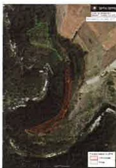
Plan de gestion des sites Natura 2000 du haut Allier Préconisations en termes de travaux d'ouverture de milieu