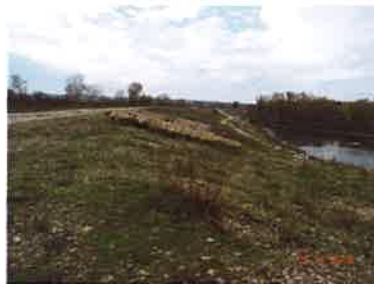
Entretien de la végétation des bords du Rhône par le pâturage (CNR)