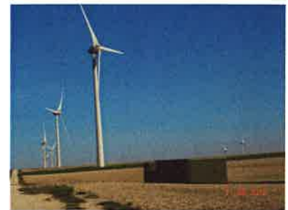
Etude d'impact agricole d'un projet éolien